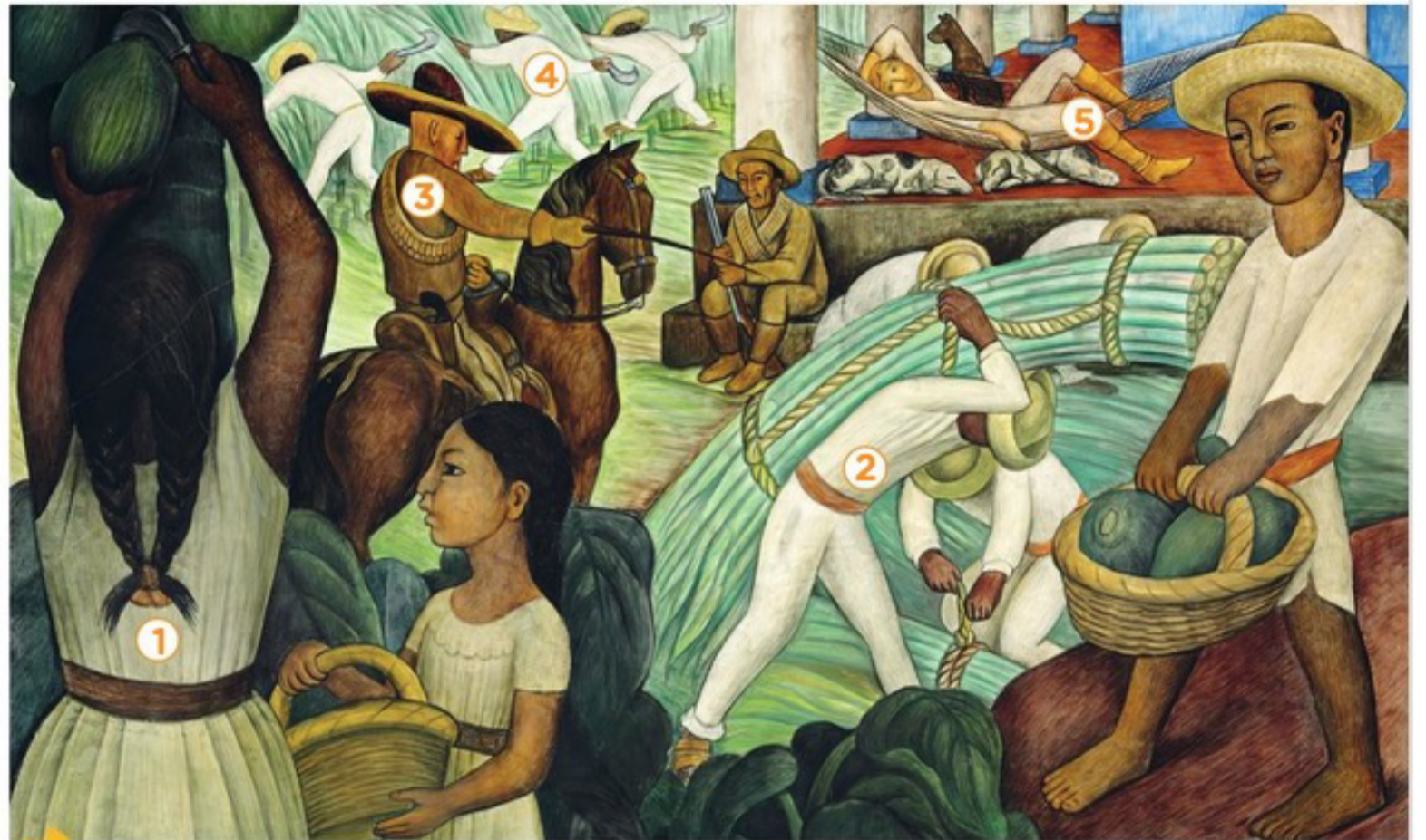
A Diego RIVERA, Caña de azúcar , fresco sobre cemento, 1931 (Philadelphia Museum of Art)