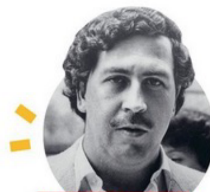
Pablo ESCOBAR (1949-1993)

Narcotraficante colombiano, líder del cartel de Medellín. Asesinó a más de 10 000 personas, desde jueces hasta ministros, e incluso declaró la guerra al Estado colombiano.