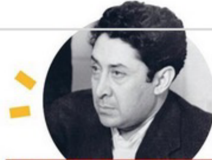
David Alfaro SIQUEIROS (1896-1974)

Pintor mexicano, está considerado uno de los mayores exponentes del muralismo mexicano. Junto con Diego Rivera, está convencido de la importancia del arte para formar la conciencia popular. Su activismo político en el PCM (Partido Comunista de México) lo lleva a varias penas de prisión.