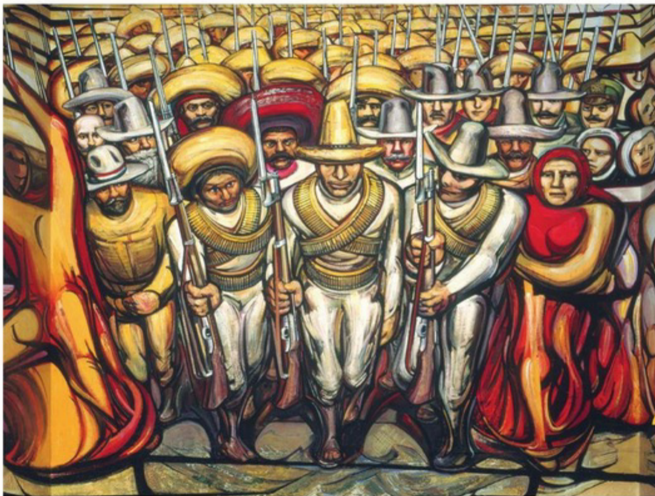
B David Alfaro SIQUEIROS, Del Porfirismo a la Revolución , acrílico y piroxilina sobre madera forrada de tela, 1957-1966 (Museo Nacional de Historia, Ciudad de México)

Pintor y muralista mexicano, famoso por sus obras de alto contenido social y político. Tras la Revolución mexicana (→ p. 32-33) recibe encargos del Gobierno para realizar grandes murales. En ellos, Rivera refleja la historia del pueblo mexicano, desde la época precolombina hasta la Revolución. También se irá a vivir a Estados Unidos, donde su activismo como comunista lo hará indeseable.