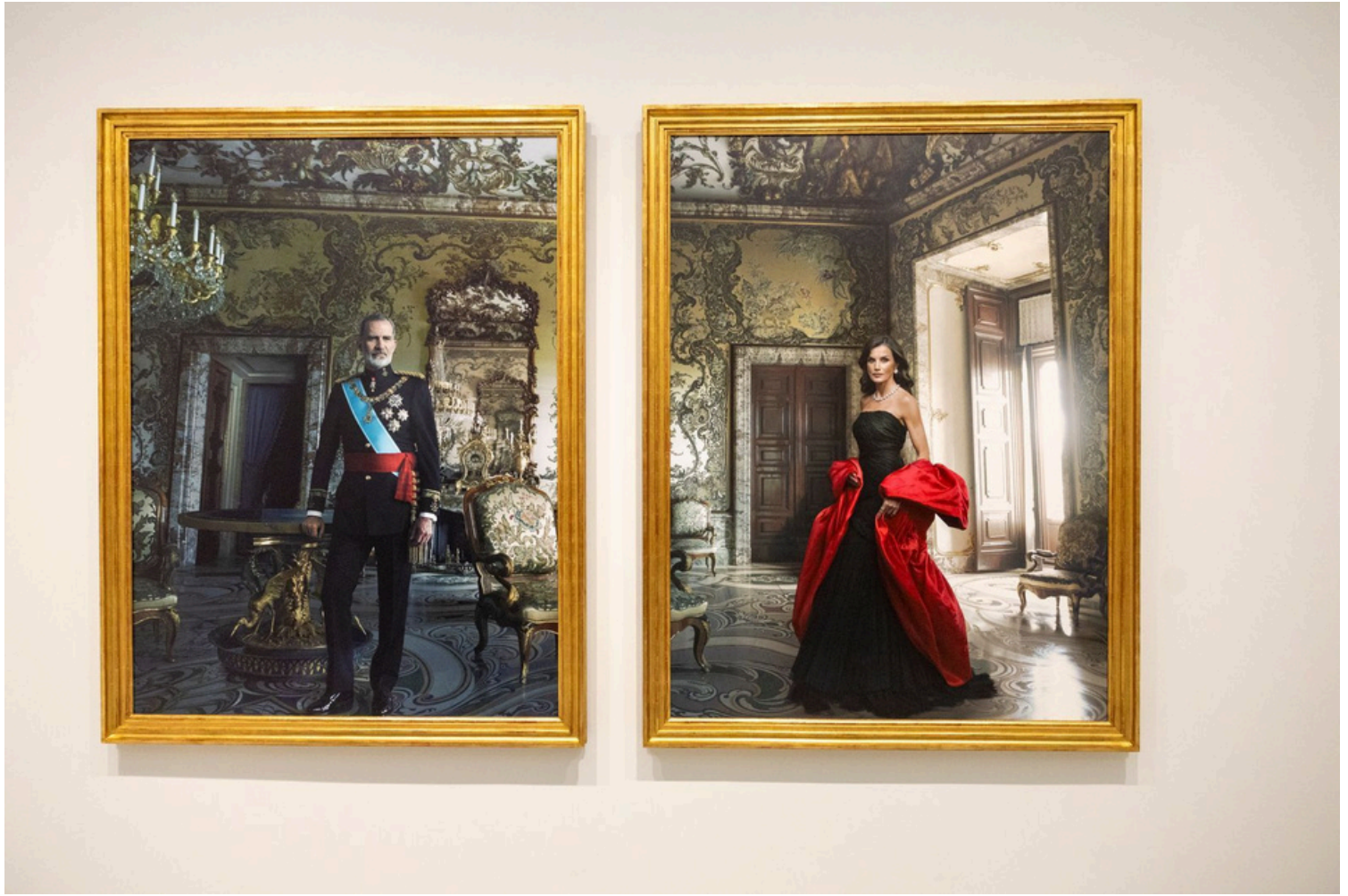
Retratos de los reyes Felipe VI y doña Letizia realizados por Annie Leibovitz, 2024

1 Presenta el documento y después presenta y describe a los perosnajes.