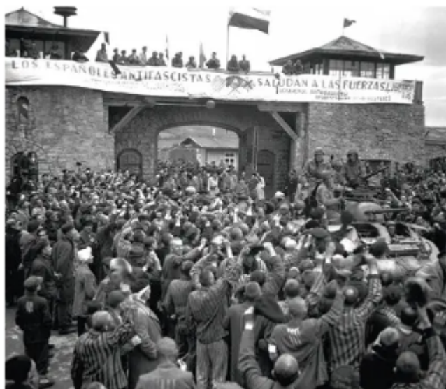
Los españoles antifascistas saludan a las fuerzas liberadoras, fotografía del campo Mauthausen en Linz, Austria, 1945.

15 Describe esta imagen con el léxico de esta página: